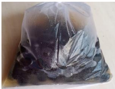
Gambar 3. Metode Perendaman benih aren dengan cendawan endofit (Syamsia et al. , 2021).

Benih aren yang telah ditanam disiram kemudian wadah stereofom ditutup. Penyiraman dilakukan apabila media terlihat kering. Parameter pengamatan adalah persentase kecambah dan panjang hipokotil pada umur 30 hari setelah tanam. Persentase kecambah dihitung menggunakan persamaan berikut ini: