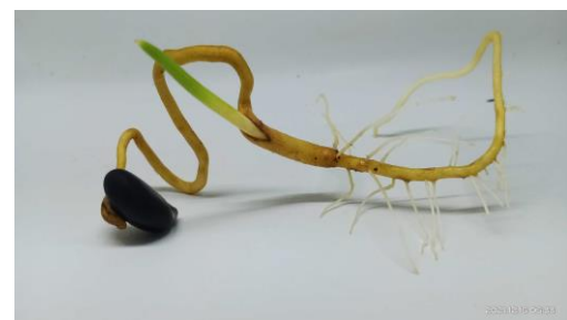
Gambar 5. Kecambah aren (Syamsia et al. , 2021).

Perkecambahan aren termasuk tipe epigeal (Nurhasybi et al. , 2003). Tipe perkecambahan epigeal ditandai dengan terangkatnya embrio ke permukaan tanah (Gambar 5).