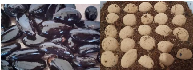
Gambar 2. Benih aren sebelum dan setelah penyelubungan dengan cendawan endofit (Syamsia et al. , 2021).

Benih aren yang telah diselubungi dan direndam dengan cendawan endofit ditanam pada wadah streoform yang telah diisi dengan media cocopeat .