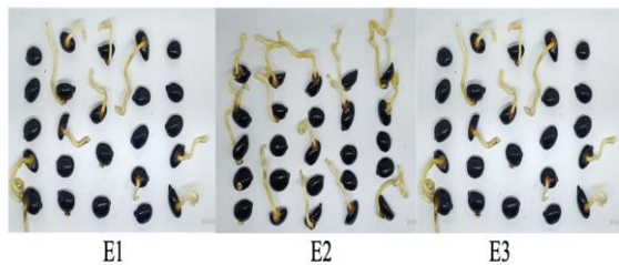
Gambar 6. Kecambah benih aren pada metode perendaman