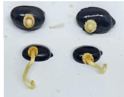
Gambar 4. Pertumbuhan apokol pada benih aren (Syamsia et al. , 2021).

Munculnya apokol berwarna putih dari bagian tengah jaringan yang berbentuk cincin dan berkembang serta memanjang merupakan fase awal pekecambahan benih aren (Gambar 4). Menurut Junaidi et al. (2020); perkecambahan aren dimulai saat munculnya jraingan berwarna putih dengan bentuk seperti cincin setelah 1-2 minggu pada bagian yang diampelas.