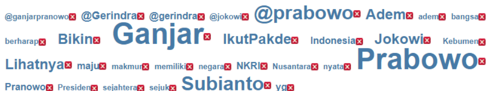
Gambar 2. Wordcloud #IkutPakdePrabowo-Ganjar

Berdasarkan gambar dibawah ini akun yang paling dominan dalam melakukan tweet adalah akun granny_2277 dengan persentasi 12,7% dan urutan kedua adalah akun MessyHairByF dengan persentase 11,3%. Hasil penelitian ini mengaji mengenai trending topic #IkutPakdePrabowo-Ganjar di Twitter melalui metode Social Network Analysis (SNA) dengan menggunakan