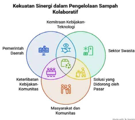
Gambar 2: Pengelolaan Sampah Kalaboratif

Pola kolaborasi meliputi kemitraan operasional layanan publik, dialog multipihak dalam perencanaan kebijakan, kontrak kerja sama pemerintah-swasta, jejaring komunitas partisipatif, serta platform kolaborasi berbasis digital.