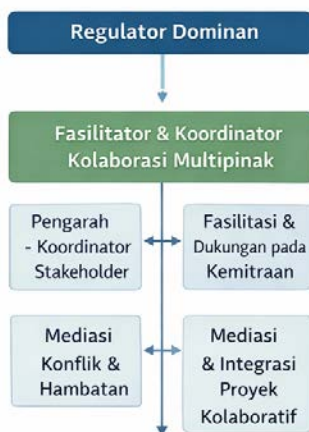
Gambar 3: Transformasi Peran Pemerintah Daerah dalam Penegelolaan Sampah

Transformasi ini menandai perubahan pendekatan dari government menuju governance yang lebih partisipatif, kolaboratif, dan adaptif.