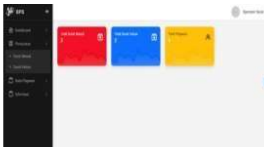
Gambar 3.6 Form update Informasi