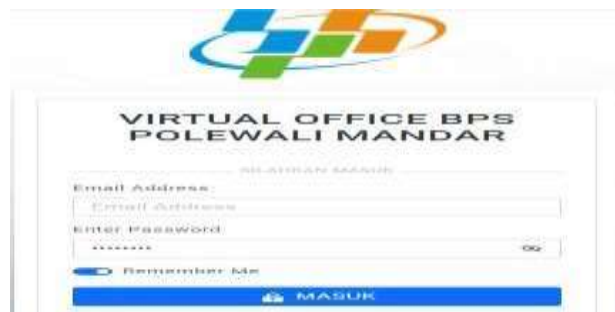
Gambar.3.9.form Halaman Login Pimpinan

Pada bagian form login pimpinan yaitu form login yang digunakan untuk login masuk ke halaman sub menu tampilan dashboard pimpinan.