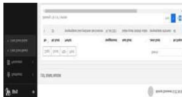
Gambar.3.10 Form Halaman Dashboard Pimpinan

Pada bagian halaman dashboard pimpinan terdapat sub menu disposisi surat masuk, dan surat keluar, jika ada surat masuk dan surat keluar yang di input operator surat maka akan tampil di bagian sub menu surat masuk untuk di disposisi oleh pimpinan,