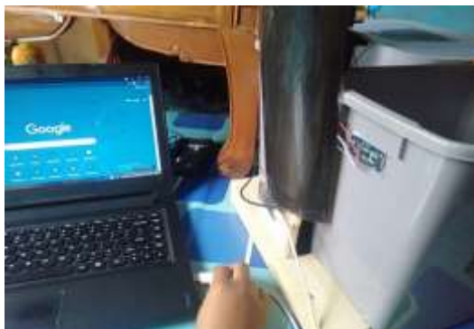
Gambar 6. Menyalakan NodeMCU dengan Labtop