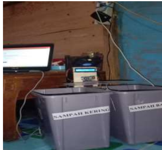
Gambar 3. Rangkaian Project Tempat Sampah Pintar

Berikut ini adalah rangkaian project tempat sampah cerdas dengan sensor ultrasonik dan sensor hujan berbasis atmega pada arduino: