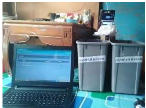
Gambar 9. Membuka aplikasi tempat sampah dan menampilkan status tempat sampah