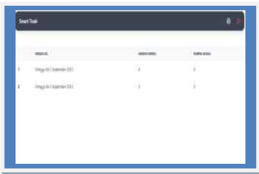
Gambar 5. Sistem Monitoring

Pada bagian halaman ini merupakan tampilan untuk melihat sistem monitoring dalam proses pemantauan kondisi sampah yang dapat dipantau diruang fakultas fikom.