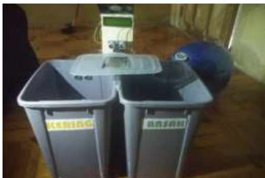
Gambar 2. Infrastruktur Teknologi