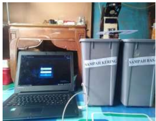
Gambar 8. Membuka aplikasi tempat sampah dan menampilkan form login