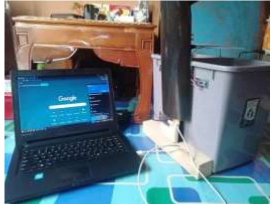
Gambar 7. Hubungkan NodeMCU dengan Labtop melalui Koneksi Hostpot