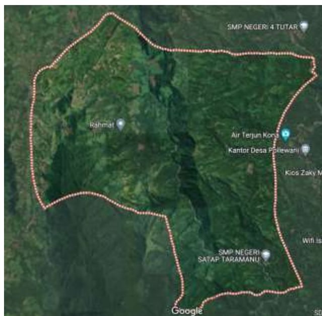
Gambar 2. Peta Citra Satelit Desa Ratte

Jarak Desa Ratte ke Ibu Kota Kecamatan adalah 66 km, yang dapat ditempuh dengan waktu sekitar 2 jam (jika tidak musim hujan). Sedangkan jarak tempuh ke Ibu Kota Kabupaten adalah 103 km yang dapat ditempuh dengan waktu sekitar 4 jam (jika tidak musim hujan). Penduduk Desa Ratte Kecamatan Tutar Kabupaten Polewali Mandar berjumlah 2.101 jiwa yang terdiri dari laki-laki 1.027 jiwa dan perempuan 1.074 jiwa dengan