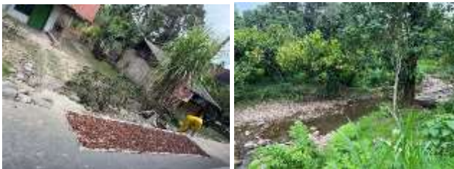
Gambar 7. Kakao merupakan salah satu komoditas pertanian unggulan di Desa Ratte

Melihat letak Geografis desa Ratte ini terletak di dataran tinggi, sehingga memberikan kondisi yang masih alami, terbukti dari pohon-pohon yang rindang, sungai yang masih jernih, sawah-sawah yang hijau, jauh dari perkotaan. Banyak pohon-pohon kelapa, pohon-pohon buah lainnya serta suara bising hewan-hewan di sana. Kekayaan alam tersebut sangat melimpah sehingga tidak hanya mencukupi untuk kebutuhan pangan masyarakat desa tetapi juga untuk masyarakat luas di Kabupaten Polewali Mandar dan sekitarnya.