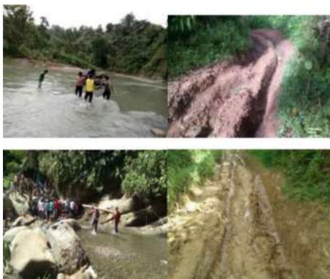
Gambar 3. Keterbatasan Infrastruktur Jalan menuju Desa Ratte

Masyarakat Desa Ratte umumnya bekerja sebagai petani-kebun dan peternak kambing. Sebagai petani-kebun berupa tanaman kakao/coklat telah dilakukan selama puluhan tahun lamanya yang dijual untuk kebutuhan ekonomi sementara dan untuk memenuhi kebutuhan pokok pangan beras dilakukan dengan menanam padi ladang di gunung setiap tahun. Selain berkebun atau bertani, masyarakat Desa Ratte khususnya di tiga dusun yaitu Dusun Ratte Barat, Dusun Ratte Tengah dan Dusun Ratte Timur juga mengembangkan peternakan kambing yang juga terkendala dalam upaya pemasaran karena kondisi jalan yang belum dibangun.