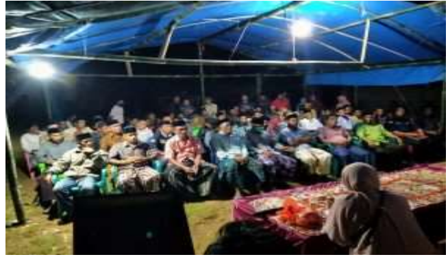
Gambar 11. Kegiatan pendampingan kelembagaan bagi masyarakat desa

Melihat peningkatan masyarakat dalam mengembangkan Desa Ratte ini akhirnya dibentuk kepanitiaan atau kepengurusan Desa, mereka juga mulai bekerjasama dengan beberapa stakeholder baik dari lingkungan pemerintahan maupun swasta terkait yang dapat meningkatkan performa sumber daya alam dan sumber daya manusia Desa Ratte.