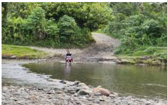
Gambar 4. Kondisi alam yang masih terjaga

Pengembangan berbasis aset ini merupakan salah satu cara untuk meningkatkan kualitas masyarakat dalam menunjang kesejahteraan. Dikarenakan dengan mengunggulkan sebuah aset yang dimiliki merupakan sebuah modal utama dalam meningkatkan keberdayaan masyarakat. Dalam ulasan berikut akan lebih dijelaskan mengenai pengembangan masyarakat melalui program Asset Based Community Development atau disingkat ABCD.