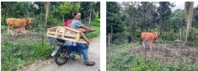
Gambar 6. Kondisi salah satu peternakan sapi di Desa Ratte

Merupakan sumber daya alam yang ada seperti : Sapi, Itik, Ayam, Sungai, Sawah, Perkebunan, Hutan, dan lain-lain. Beberapa modal alam ini sangatlah bagus dalam meningkatkan ekonomi masyarakat khususnya, sebagai contoh adanya Perkebunan, merupakan sebuah destinasi yang menarik jikalau dapat disosialisasikan dengan bungkus (frame) yang indah.