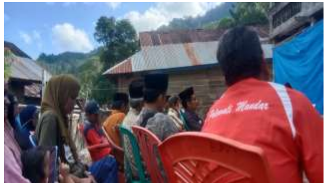
Gambar 12. Antusiasme masyarakat dalam mengikuti sosialisasi program desa

Masyarakat Desa Ratte ikut aktif dalam menunjang program menuju Desa Maju, salah satu upaya yang dilakukan masyarakat Ratte dalam wujud jaringan sosial dalam mengenal dan mendalami system informasi berbasis digital yang mampu menguatkan potensi sumber daya manusia Desa Ratte.