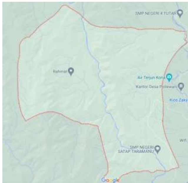
Gambar 1. Peta Desa Ratte