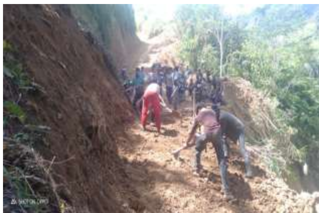
Gambar 5. Kegiatan gotong royong dan kerjabakti oleh masyarakat desa

Masyarakat Desa Ratte ikut aktif dalam menunjang berdirinya Desa Maju, salah satu upaya yang dilakukan masyarakat Ratte dalam wujud gotong royong perbaikan Desa, selain itu sebagian besar masyarakat sudah memiliki usaha dan keterampilan masing-masing disetiap rumahnya, dari berbagai usaha dan keterampilan para warga dapat menambah indah dan majunya Desa Ratte.