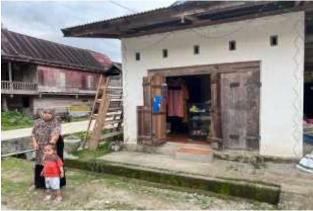
Gambar 9. Warung sebagai salah satu sarana perekonomian desa