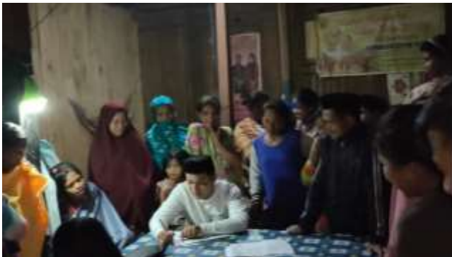
Gambar 10. Kegiatan rembuk desa untuk struktur pengurus lembaga desa

Dalam aset ini meliputi kemampuan gotong royong, jaringan sosial dan harmoni sosial, serta keaktifan beberapa Lembaga Masyarakat Desa seperti kelompok Majelis Taklim (MT), Kelompok Tani dan Kelompok Pemuda masyarakat Ratte/KPMR. Kelebihan-kelebihan ini digunakan untuk melakukan sesuatu dengan partisipasi yang penuh dalam mengelola sumber daya alam secara maksimal dan terukur.