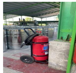
Gambar 1. Alat Pemadam Api Ringan (APAR)

Hasil pengamatan menunjukkan bahwa fasilitas proteksi kebakaran aktif di PT. KHBL Binuang mencakup 48 unit APAR dan 11 unit hydrant, yang seluruhnya dalam kondisi operasional baik, sesuai standar teknis yang diatur dalam Peraturan Menteri Pekerjaan Umum No. 26/PRT/M/2008.