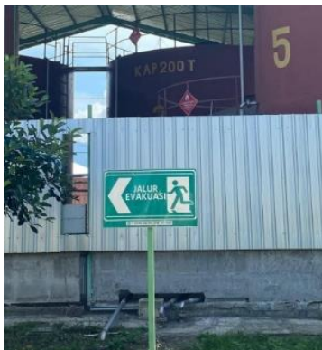
Gambar 4. Jalur Evakuasi

Terletak di sisi kiri ruang kantor yang dilengkapi dengan tulisan tanda pintu darurat serta dilengkapi engsel sisi.