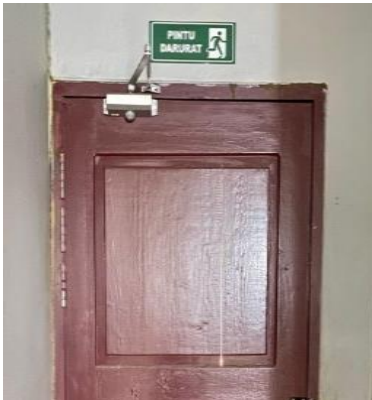
Gambar 3. Pintu Darurat

2. Penerapan Sistem Proteksi Kebakaran Pasif Fasilitas proteksi pasif yang ada meliputi jalur evakuasi, pintu darurat, dan titik kumpul. Jalur evakuasi sudah diberi tanda warna hijau dengan petunjuk arah yang jelas, Titik kumpul telah ditetapkan di area terbuka dengan jarak aman >20 meter dari bangunan dan dilengkapi papan petunjuk.