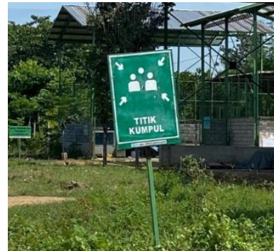
Gambar 5. Titik Kumpul

Dipasang di beberapa titik salah satunya di area depan bangunan produksi terpentine yang mengarah langsung area titik kumpul jika terjadi kebakaran.