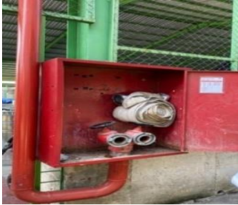
Gambar 2. Hydrant

Terdapat di Area Gudang Produk Gondorukem yang berjenis powder dan foam yang siap digunakan.