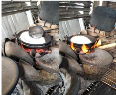
Gambar 2. Pembentukan Adonan

Adonan dibentuk bulat pipih menyerupai roti tipis. Seperti pada gambar berikut :