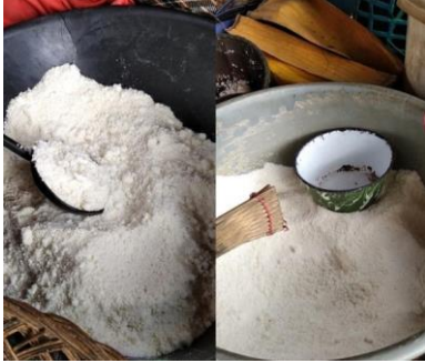
Gambar 1. Adonan Jeka

Singkong parut dicampur dengan kelapa parut, sedikit garam, dan air hingga membentuk adonan. Seperti pada gambar berikut :