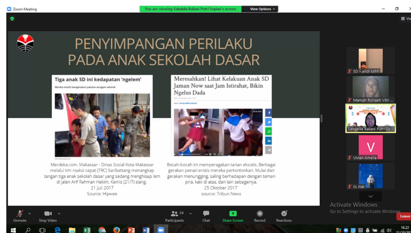
Gambar 1. Penyuluhan Pentingnya Memahami Pendidikan Karakter Islami Anak Bagi Calon Guru SD

Kata kunci: Mahasiswa PGSD, Pendidikan Karakter Islami, Siswa SD