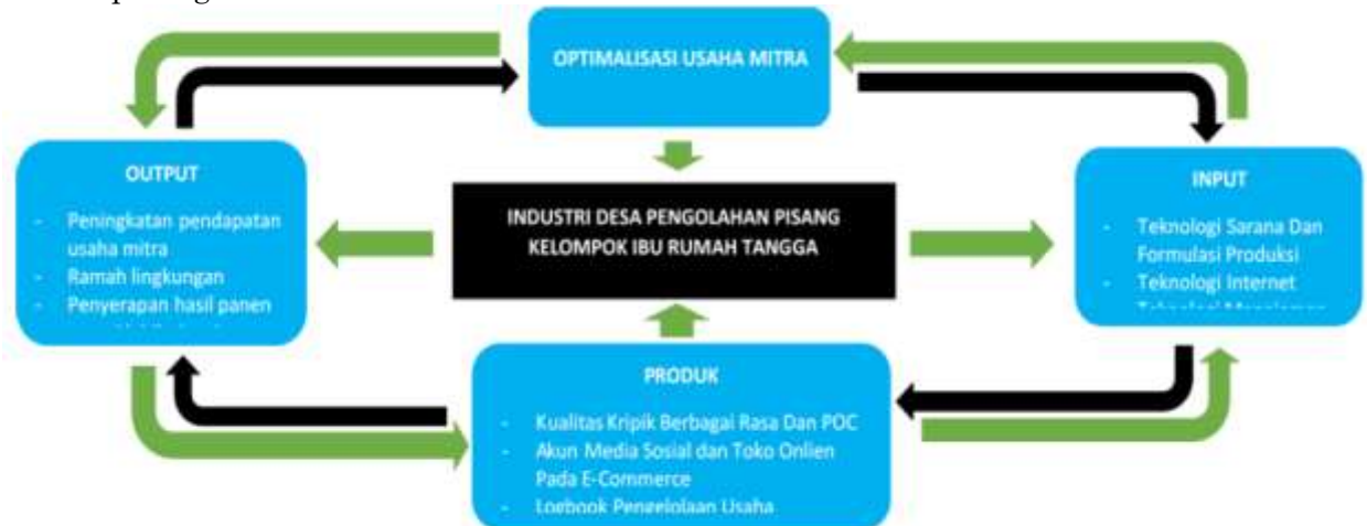
Gambar 3. Skema Penerapan Teknologi

Pengabdian dilaksanakan berdasarkan acuan penerapan teknologi yang disusun tim pelaksana. Transfer ilmu dan teknologi dalam bentuk pelatihan berlandaskan dengan item inovasi dan teknologi yang telah ditetapkan. Adapun skema penerapan teknologi dapat dilihat pada gambar 3 dibawah ini: