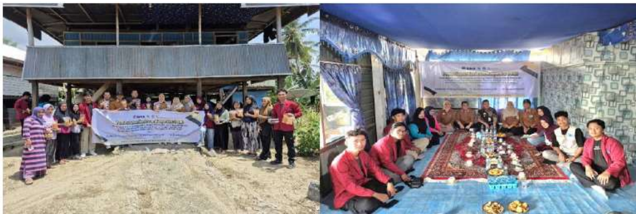
Gambar 8. Tim Pelaksana Dan Mitra Masyarakat

Secara keseluruhan, penerapan teknologi pengolahan pisang kepok dan pemanfaatan limbahnya berhasil memberikan manfaat ekonomi, sosial, dan lingkungan. Dengan dukungan pelatihan berkelanjutan, usaha ini berpotensi berkembang menjadi industri desa yang mandiri, berdaya saing, dan berorientasi pada keberlanjutan. Lebih jauh, program ini juga berfungsi sebagai sarana pendidikan nonformal bagi perempuan desa. Melalui kegiatan praktik langsung, peserta memperoleh pengalaman kewirausahaan yang dapat diaplikasikan dalam pengembangan usaha lainnya. Hal ini sejalan dengan pandangan Djadjuli et al. (2025) bahwa pelatihan kewirausahaan merupakan bentuk pendidikan alternatif yang dapat meningkatkan kapasitas individu.