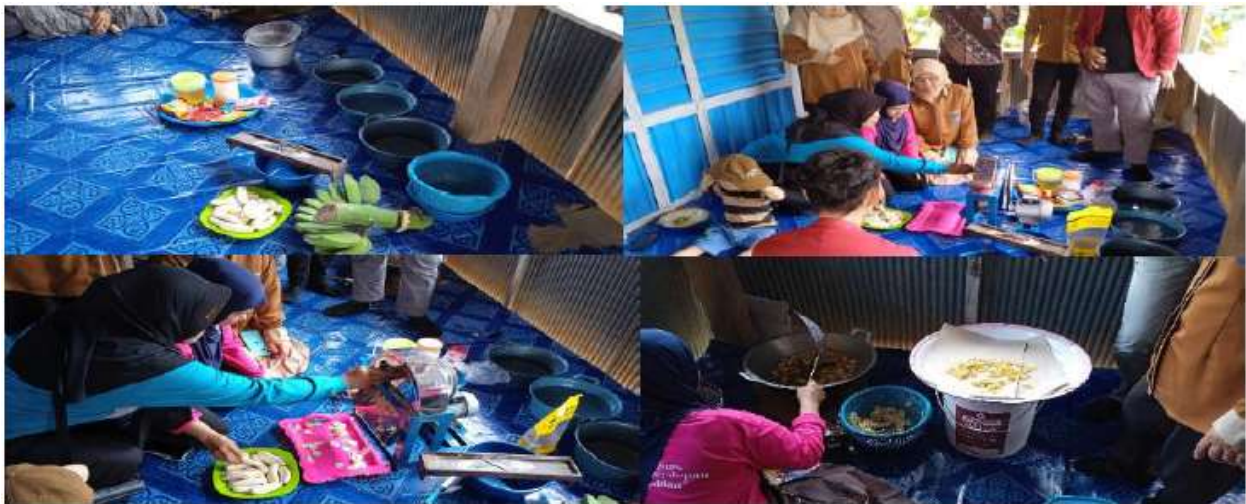
Gambar 6. Proses Pembuatan Kripik Pisang

Limbah kulit pisang yang sebelumnya dibuang kini dapat dimanfaatkan sebagai tepung alternatif. Inovasi ini tidak hanya mengurangi pencemaran lingkungan tetapi juga membuka peluang produk baru berbasis bahan baku lokal. Rofiah dan Eryana (2025) menyebut bahwa kewirausahaan berbasis budaya dan inovasi pangan mampu memperkuat ekonomi lokal sekaligus menjaga keberlanjutan lingkungan. Dengan demikian, penerapan ekonomi sirkular terbukti efektif dalam memaksimalkan pemanfaatan sumber daya lokal. Pemanfaatan limbah menjadi produk bernilai ekonomi menegaskan bahwa pengelolaan pangan desa dapat berjalan selaras dengan prinsip pembangunan berkelanjutan (Sa'ban & Purnamasari, 2025).