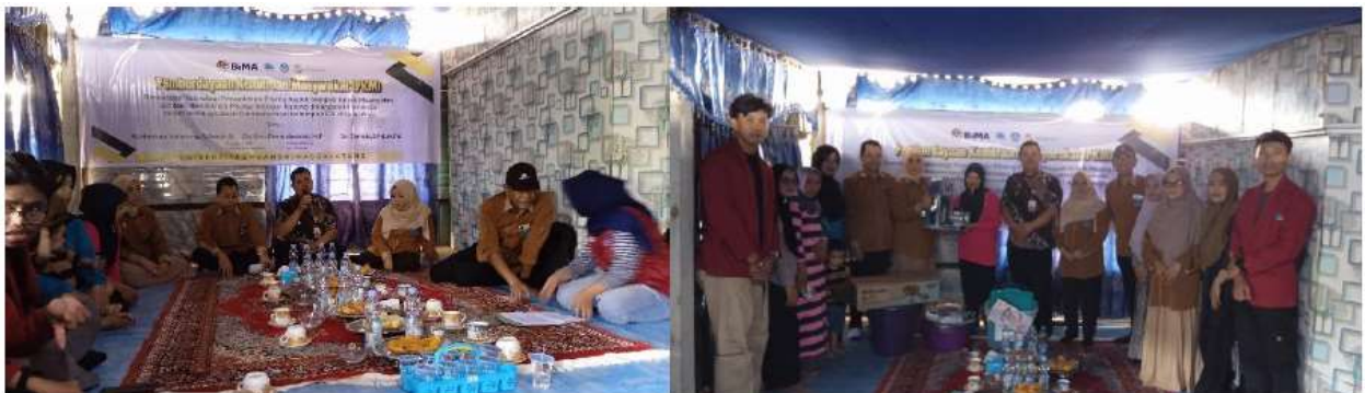
Gambar 5. Sambutan Kepala Desa Dan Penyerahan Sarana Produksi

Peningkatan keberdayaan mitra pada tabel 1 membuktikan efektivitas pelatihan yang dilakukan. Hasil kegiatan juga meningkatkan kepercayaan diri masyarakat setelah kegiatan setelah diberikan pemaparan terkait potensi ekonomi yang dimiliki usahanya. Peningkatan pendapatan yang diperoleh setelah kegiatan dapat meningkat jika mitra konsisten melakukan peningkatan keterampilan. Selain peningkatan kuantitas keberdayaan juga didapati peningkatan kualitas usaha yang tercermin dari kualitas produk dan metode pemasaran yang dilakukan.