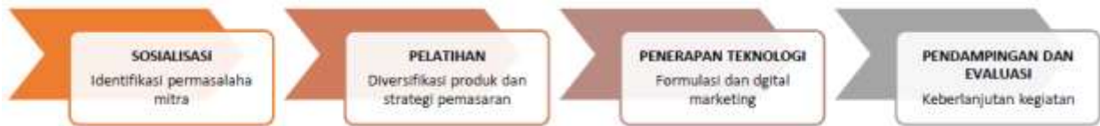
Gambar 2. Tahapan Pelaksanaan Pengabdian

Pengabdian dilaksanakan berdasarkan acuan penerapan teknologi yang disusun tim pelaksana. Transfer ilmu dan teknologi dalam bentuk pelatihan berlandaskan dengan item inovasi dan teknologi yang telah ditetapkan. Adapun skema penerapan teknologi dapat dilihat pada gambar 3 dibawah ini: