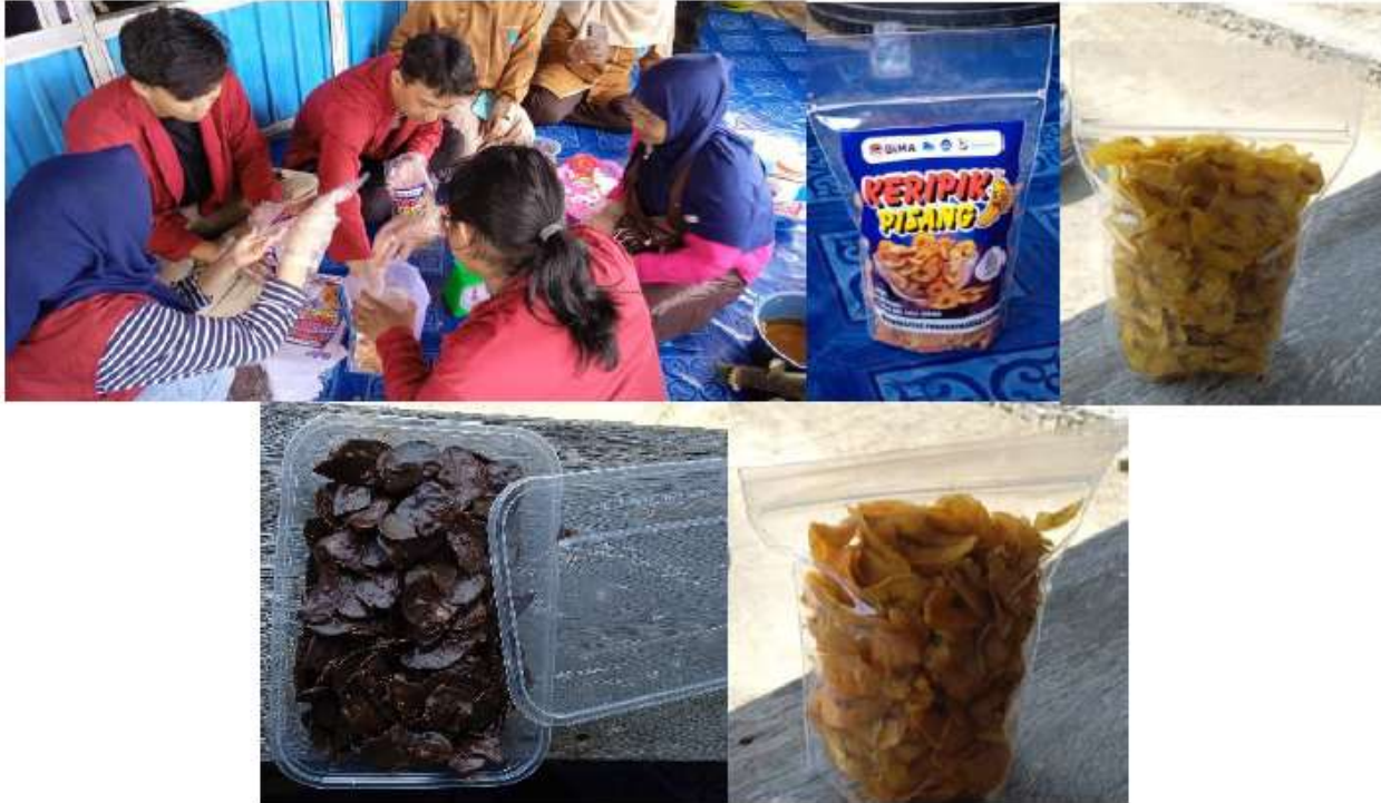
Gambar 7. Pengemasan Kripik Pisang Rasa Original, Balado Dan Coklat

Keberhasilan program ini juga mendukung ketahanan pangan lokal. Desa tidak hanya menjual pisang dalam bentuk mentah, tetapi mengolahnya menjadi produk bernilai tambah. Hal ini memperkuat kemandirian pangan sekaligus membuka peluang usaha baru yang berkesinambungan. Selain manfaat ekonomi, program ini juga memberikan dampak sosial dengan memperkuat peran perempuan desa dalam pembangunan. Keterlibatan perempuan dalam pengelolaan usaha pangan lokal mampu meningkatkan posisi tawar mereka di masyarakat.