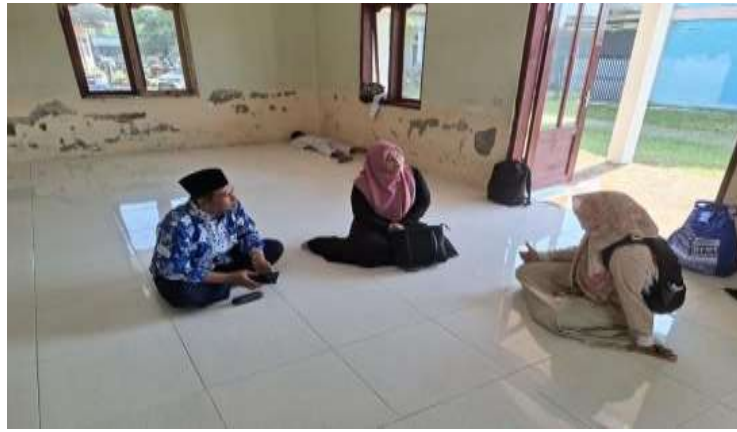
Gambar 2. Observasi Langsung Ke Sekolah dan Wawancara Dengan Ibu Kepala Sekolah