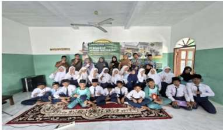
Gambar 4. Sosialisasi Moderasi Beragama di SMP As- Syafaah dengan Tiktok

adegan tiga orang teman yang berbeda agama sedang bermain permainan tradisional "ABC 5 Dasar". Awalnya, perbedaan agama dan ego masing-masing sempat memicu ketegangan kecil, namun konflik tersebut berhasil diselesaikan dan disatukan melalui sikap toleransi dan penerapan nilai-nilai moderasi beragama