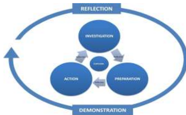
Gambar 1. Tahapan Service Learning Menurut Kaye

terdapat empat tahapan utama dalam metode service learning ini, yaitu investigasi, persiapan, pelaksanaan tindakan, dan evaluasi melalui refleksi.