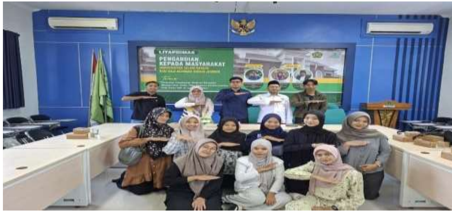
Gambar 3. Pelaksanaan FGD Moderasi Beragama