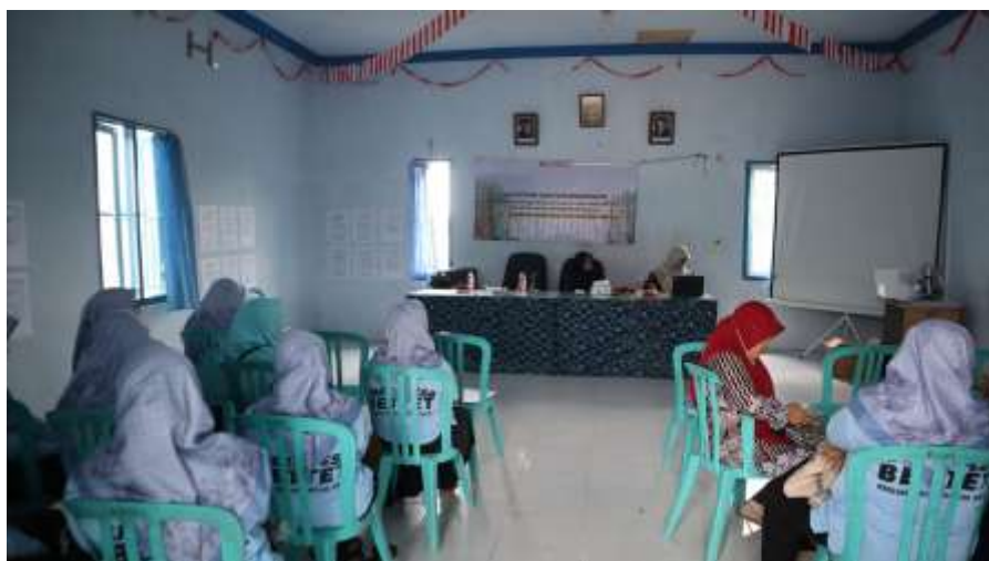
Gambar 1. Dokumentasi Kegiatan PKK Desa Bettet Pamekasan

Kata kunci: UMKM; inovasi produk; digital marketing; pemberdayaan perempuan; ekonomi desa