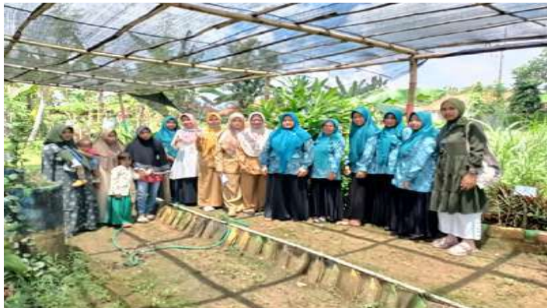
Gambar 5. Sosialisasi alat inovasi Fisher Boncalang

Selanjutnya dilakukan Focus Group Discussion (FGD) antara tim pengabdian dan mitra untuk mengidentifikasi persoalan pada aspek produksi, pengemasan, dan pemasaran, sekaligus merumuskan alternatif solusi yang sesuai dengan kebutuhan mitra. FGD menjadi tahapan penting karena menghasilkan pemetaan masalah yang menjadi dasar pelaksanaan intervensi program secara partisipatif (A. H. Julyaningsih, W. R. Windarsari, I. M. Hamdani, & A. N. F. Rahman, 2025).