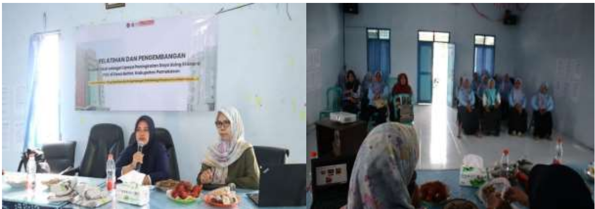
Gambar 3. Survei Sekaligus Sosialisasi

Kegiatan pemberdayaan masyarakat dilaksanakan pada kelompok PKK Desa Bettet Kecamatan Pamekasan Kabupaten Pamekasan sebagai mitra sasaran yang terdiri atas ibu rumah tangga produktif. Permasalahan utama mitra meliputi kapasitas produksi yang masih terbatas, kualitas kemasan produk yang belum optimal, serta pemasaran yang masih bersifat konvensional dan belum didukung pemanfaatan teknologi digital secara maksimal. Kondisi tersebut berpotensi menghambat perkembangan usaha dan daya saing produk apabila tidak dilakukan intervensi melalui program pemberdayaan yang terarah (S. Yolanda & M. I. P. Nasution, 2026).