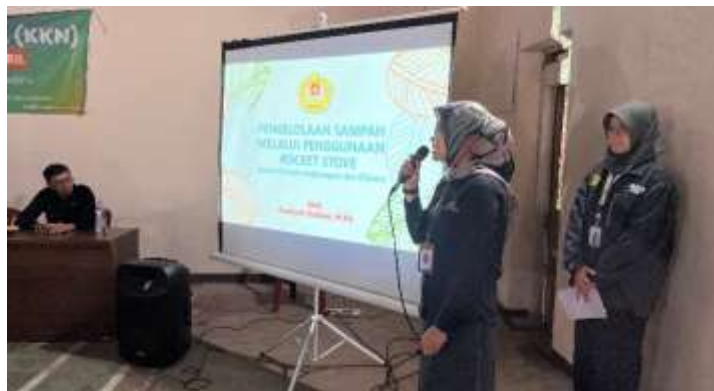
Gambar 6. Edukasi Pengelolaan Sampah melalui Penggunaan Rocket Stove

Program pengabdian kepada masyarakat ini dilaksanakan bukan hanya menciptakan alat untuk pembakaran sampah yang ramah lingkungan saja, tapi juga digunakan untuk menambah pemahaman masyarakat tentang cara mengelola sampah yang lebih efektif melalui penggunaan teknologi yang tepat. Pembutan rocket stove diharapkan mampu membantu mewujudkan desa yang lebih bersih dan sehat.