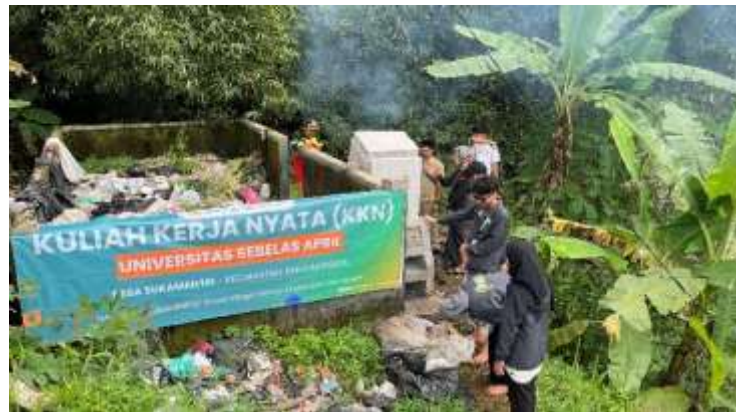
Gambar 8. Demonstrasi Penggunaan Rocket Stove

Keterlibatan aktif pegawai desa turut memperkuat legitimasi program khususnya di mata masyarakat Desa Sukamantri. Kehadiran mereka tidak hanya membantu memperkenalkan program kepada warga, tetapi juga memberikan dukungan nyata terhadap inisiatif pengelolaan sampah berbasis teknologi tepat guna.