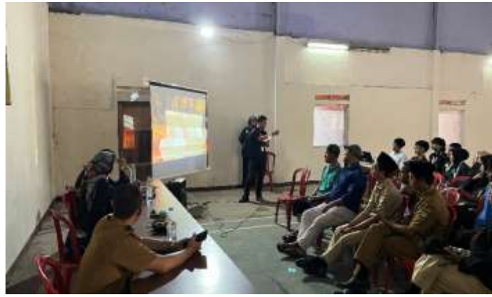
Gambar 8. Pelatihan Penggunaan Rocket Stove

Keterlibatan aktif pegawai desa turut memperkuat legitimasi program khususnya di mata masyarakat Desa Sukamantri. Kehadiran mereka tidak hanya membantu memperkenalkan program kepada warga, tetapi juga memberikan dukungan nyata terhadap inisiatif pengelolaan sampah berbasis teknologi tepat guna.