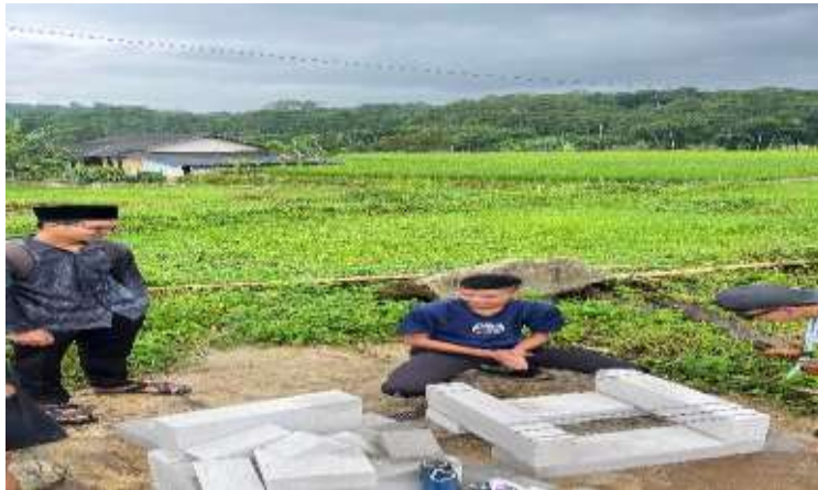
Gambar 4. Tahap pembangunan rocket stove

Proses pembangunan rocket stove dilakukan dengan melibatkan pegawai desa dan warga masyarakat Desa Sukamantri. Proses pembangunan dimulai dari pengadaan bahan-bahan yang diperlukan, seperti hebel, semen, dan besi. Selanjutnya, pengarahan mengenai konstruksi dan cara kerja rocket stove sampai ke pembangunan rangka.