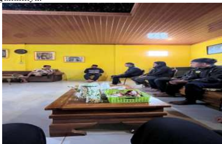
Gambar 3. Koordinasi awal pembangunan rocket stove

Tahap observasi dilaksanakan dengan melakukan koordinasi bersama pejabat pemerintahan desa, meliputi Sekretaris Desa, Kadus, RW, dan RT. Tujuan utama observasi adalah memetakan kondisi pengelolaan sampah secara aktual di tingkat desa terutama sampah rumah tangga, serta memahami kebiasaan warga dalam mengelola sampah. Koordinasi awal dilakukan melalui rapat bersama seluruh pemangku kepentingan terkait untuk menentukan pembangunan rocket stove dari segi jumlah, kapasitas, dan titik koordinat pembangunannya.