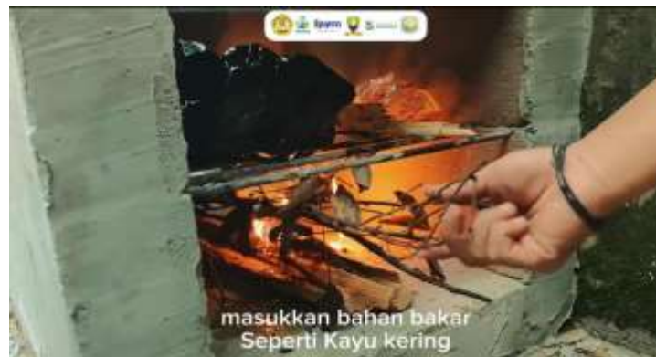
Gambar 7. Video demonstrasi yang dipublikasikan di media sosial

Setelah dilakukan pelatihan mengenai rocket stove , angket/kuesioner diberikan kepada peserta untuk mengetahui dampak dari program pengabdian yang telah dilaksanakan. Hasil dari pengisian kuesioner tersebut diperoleh data bahwa 89% peserta lebih menyadari pentingnya pengelolaan sampah yang baik, 82% peserta menyatakan rocket stove mudah dioperasikan, 80% peserta menyatakan asap yang dihasilkan rocket stove lebih sedikit dibandingkan pembakaran tradisional, dan 85% peserta mempunyai keyakinan untuk menggunakan rocket stove dalam mengelola sampah mereka. Masyarakat