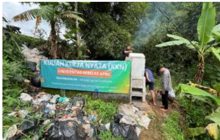
Gambar 5. Percobaan penggunaan rocket stove untuk membakar sampah

Pengujian proses pembakaran sampah menggunakan Rocket Stove dilaksanakan untuk mengetahui bahwa rocket stove beroperasi dengan baik dan asap yang keluar sedikit. Jenis sampah yang digunakan pertama kali dalam proses pengujian pembakaran yaitu sampah kering agar lebih mudah terbakar. Setelah sampah kering terbakar dengan baik, baru sampah basah dimasukkan di atasnya.