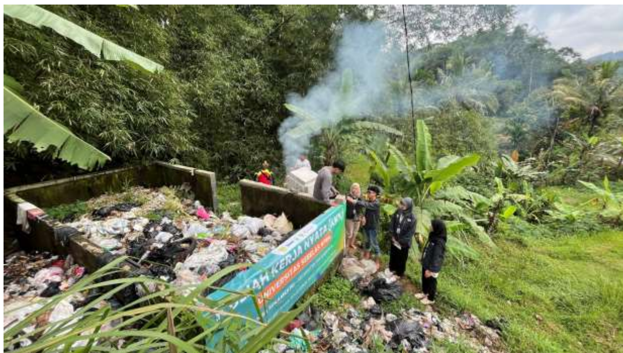
Gambar 1. Uji Coba Rocket Stove Bersama Perangkat Desa dan Masyarakat

dianggap tidak bernilai dan merupakan hasil langsung dari aktivitas manusia. Secara fisik, wujudnya serupa dengan barang yang berguna, namun dibedakan berdasarkan kurangnya nilai guna akibat tercampurnya berbagai jenis material (McDougall et al., 2001).